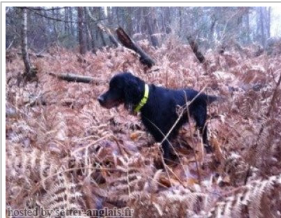
hosted by setter-anglais.fr

2014-01-01 (F) LOF 43341 Titres : TAN / Dyspl. : C fiche affixe