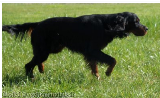
hosted by setter-anglais.fr

2012-02-05 (M) LOF 42038 Titres : TR / Dyspl. : B fiche affixe