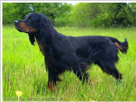
hosted by setter-anglais.fr

2012-01-08 (M) LOF 41904 Titres : TR / Dyspl. : B fiche affixe