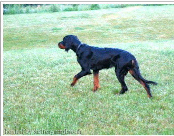
hosted by setter-anglais.fr

(F) LOF 35533/7428 Dyspl. : A fiche affixe