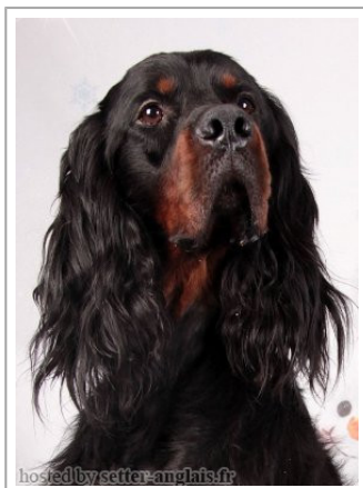
hosted by setter-amphis.fr

2011-04-22 (M) LOF 41086 Titres : TR -CH-FGT - CH CS / Dyspl. : A