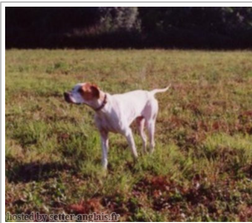
hosted by setter-anglais.fr