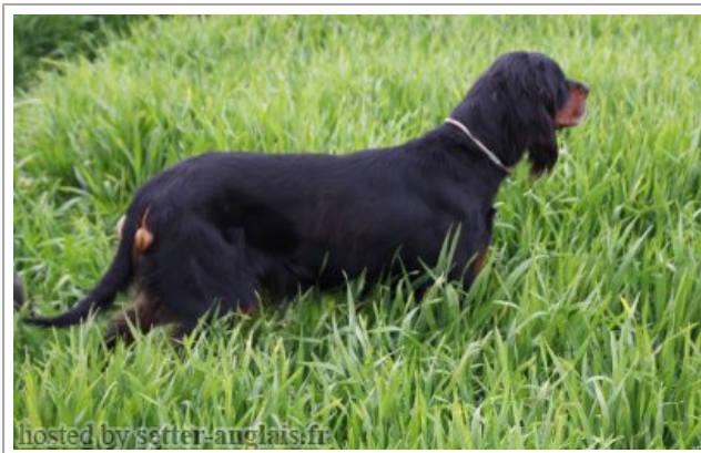
hosted by setter-auclais.fr

2009-03-27 (M) LOF 39486 Dyspl. : C fiche affixe