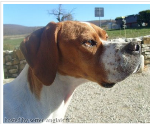
hosted by setter-anglais.fr

2010-08-24 (F) LOF 100689/18958 fiche affixe