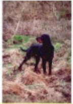
Photo de l'animal Photo de l'animal

Note : les données ne sont pas garanties. Elles ont été entrées par les membres sans garantie d'exactitude.