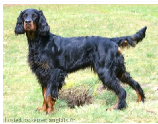
hosted by setter-anglais.fr

(F) DPSZ15/001 Titres : Dt.JCh.(VDH), Ch.RO.;H.Ch. / Dyspl. : A fiche affixe