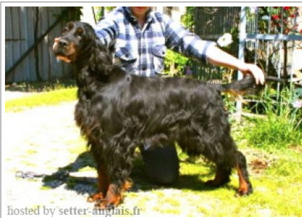
hosted by setter-anglais.fr

2009-08-05 (F) LOF 6/697 Dyspl. : A fiche affixe