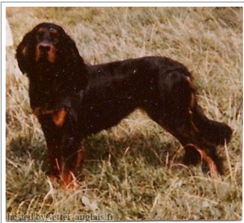
hosted by: setter-anglais.fr