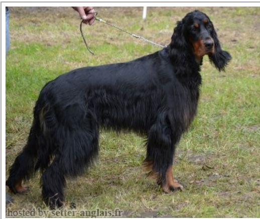
hosted by setter-anglais.fr

2012-02-18 (M) LOF INCONNU74 Titres : CHCS, CHIE, CHIB, CH Luxembourg fiche affixe